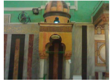
صورة لفتحة الغار