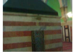
صورة لدكة المبلغ -السدة-