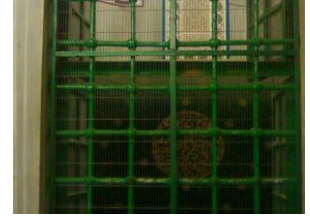
صورة لحاجز عسكري على مدخل الحرم الشريف