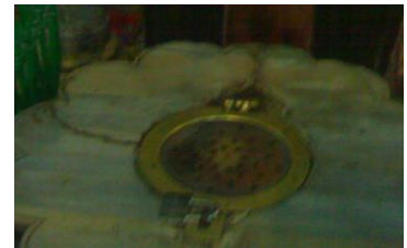
صور لمقام سيدنا إبراهيم عليه السلام